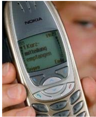
So funktioniert der SMS-Versand und -Empfang bei einem Mobilfunknetz.

Bei Prepaid-Karten wird im Moment des SMS-Versandes die Rechnungsinformation erstellt. Dabei stellt die Vermittlungsstelle im HLR fest, dass der Kunde auf Prepaid-Basis telefoniert. In den entsprechenden Billingssystemen wird dann das Guthabenkonto überprüft und berechnet, wie viel das Gespräch bzw. die SMS kosten wird. Bei einer SMS ist dieses recht einfach, da sie eine abgeschlossene Nachricht ist, die Vermittlungsstelle bzw. das SMS-C benötigt nur die Information "darf gesendet werden" oder nicht. Bei Vertragskunden wird im Rechnungssystem ein Eintrag hinterlegt, dass und wohin die SMS versendet wurde. Im Rechnungslauf wird dieser Eintrag dann ausgelesen.